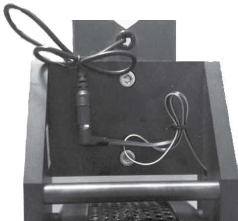
BACK OF THE FLYWHEEL

La prise mâle de 3,5 mm et La fiche femelle de 3,5 mm sortant de l'avant du SpeedStroke ou du MultiStroke il faut simplement les brancher. Sécurisez le fil qui reste avec les attaches de câble fournies. Lorsqu'il est branché, ce câble permet un transfert de données du rotor à la console embarquée. (voir les images 1 et 3)